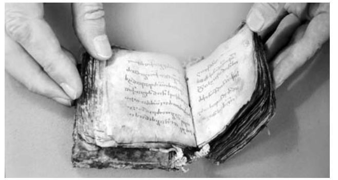
დროს პალესტინის მონასტრებში შექმნილი ხელნაწერებიც. ხელნაწერთა ეროვნული ცენტრის მიზანია, გაავრცელოს სამუშაოები, რომელიც აქამდე, მე-19 საუკუნიდან მე-20 საუკუნის ჩათვლით, იყო ჩატარებული. ამ კოლექციის კატალოგიზების და შესწავლის თვალსაზრისით, დღეს პირველად ამოცანათა შორის ერთიანი მონაცემთა ბაზის შექმნა ქართულ და ინგლისურ ენებზე, ასევე, ქართულ ხელნაწერთა ერთიანებული კატალოგის გამოცემა.“