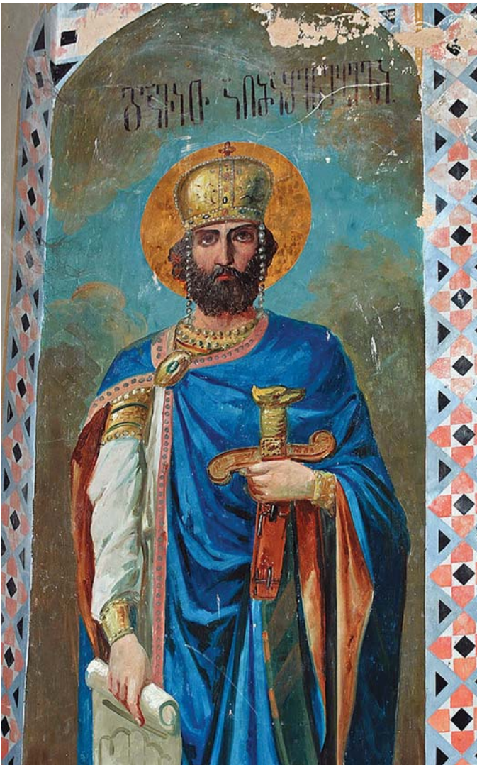
შიომღვიმის მონასტრის ფრესკა