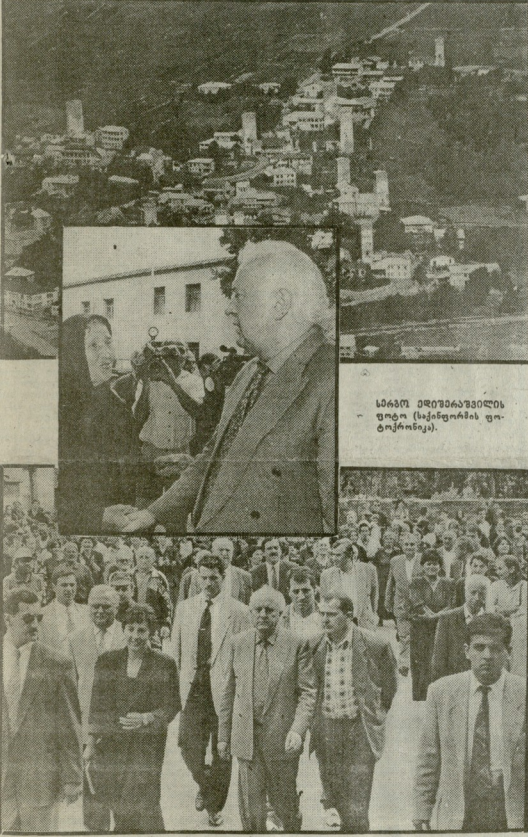
სამხრეთ-დასავლეთის რაიონის (სამხრეთის რაიონის) სოფელი

სამხრეთ-დასავლეთის რაიონის (სამხრეთის რაიონის) სოფელი. სოფლის მოსახლეობის მრავალი ნაწილი უკვე დატოვა სოფელი და გადასახლდა ქალაქებში. სოფლის მოსახლეობის მრავალი ნაწილი უკვე დატოვა სოფელი და გადასახლდა ქალაქებში. სოფლის მოსახლეობის მრავალი ნაწილი უკვე დატოვა სოფელი და გადასახლდა ქალაქებში.