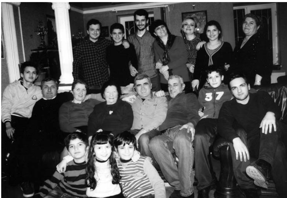
ნათელა მასწავლებელი შვილებთან და შვილიშვილებთან ერთად