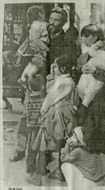
მს ჩვენი საპარტიო