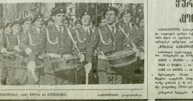
თბილისი, 1905 წლის 26 ნოემბერი. საინფორმაციო ფოტოგრაფია.

გვიჩვენე მოსახლეობის უფლებების დაცვას და მათი ინტერესების დაცვას. „ურაგანი“ ტექნიკის მწვერულია.