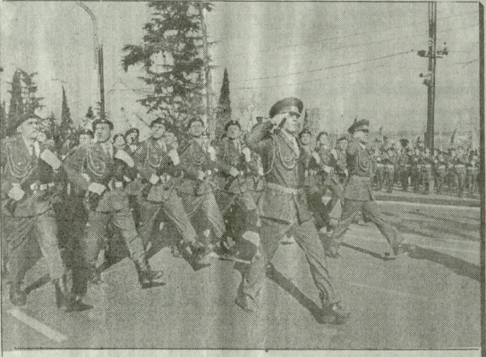
თბილისი, 1905 წლის 26 ნოემბერი. საინფორმაციო ფოტოგრაფია.

სამხედრო ფიცი 80, საქართველოს რესპუბლიკის მოქალაქე, შედევარი ან საქართველოს შვიარდებულ ძალების მშენებლობისში. ფიცს, პირდაპირად მივებია ჩემი მხედრული ვალი საქართველოს წინაშე; ვფიცავ, ცოცხლობისთვის შევიწყოლო სამხედრო საქმე, ღირსეულად განვატარო წინასწარ მხედრული ტრადიციები; ვფიცავ, მტკიცედ დავიცავ მხედრული დისციპლინა, როგორც სამხედრო ფიცის ძირითად საფუძვლად საფუძვლად; ვფიცავ, შევიზნაო ჩემთვის მონდობილი სამხედრო სადგომი; შევასრულო სამხედრო წესების ყველა მოთხოვნა და მეთოდის პატივსაცემი; ვფიცავ, მტკიცედ დავიცავ საქართველოს საზღვარს და სიოცხლის უნაჩანებელ წუთშივე ვიბრძოლო მტერსე ვამარჯვებთათვის; თუ ვაგვიტყვამ ფიცს, ვახსოვებებელი ვიქნები დღეს და ქვეყნის წინაშე ვფიცავავედს ღმერთი!