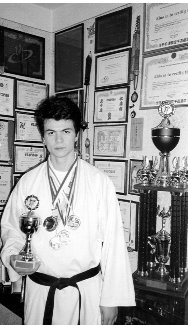
რადგან ამ დროისათვის უკვე ორგანიზაციული და ფინანსური საკითხები უფრო დახვეწილი იქნება.

— ნოემბერში იგეგმება მსოფლიო ჩემპიონატი ლოს-ანჯელესში და იქ, ალბათ, უფრო დიდი შემადგენლობით წავალთ,