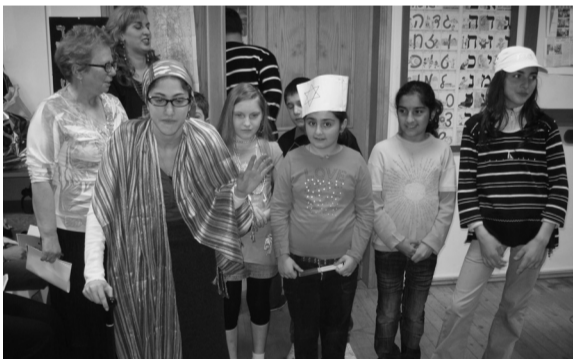
მოამზადა ლილია ხომენკო