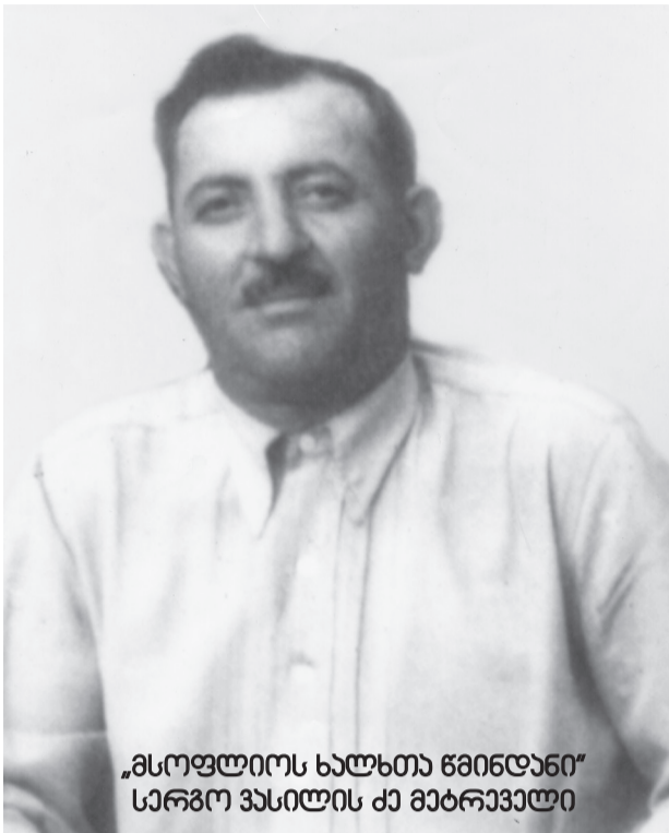
„მსოფლიოს ხალხთა წმინდანის“ სერგო ვასილის ძე მეტრეველი