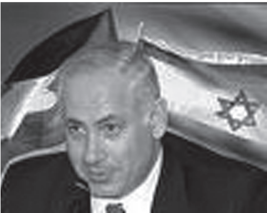
ნეთანიაჰუს მინიშნება უჩიე ხაილმან

რომ არა ერთი გარემოება, ეს იყო ჩვეულებრივი, არაფრით საყურადღებო სიტყვა, წარმოთქმული ნიუ-იორკში მეგობრული აუდიტორიის წინაშე.