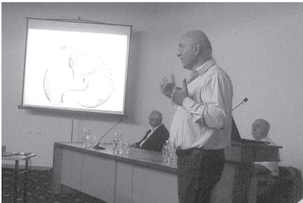
პროფესორი მერაბ სარელი (ისრაელაშვილი)

თსსუ-ს ერთ-ერთ დარბაზში პროფესორებთან შესახვედრად და მათი ლექციების მოსასმენად, სამედიცინო სფეროში არაერთმა წამყვანმა სპეციალისტმა მოიყარა თავი, რაღა თქმა უნდა, აქ იყვნენ თსსუ-ს პროფესორ-მასწავლებლები, სტუდენტები და ის ადამიანები, რომლებსაც უბრალოდ გაგონილი ჰქონდათ ამ ცნობილი მეცნიერების სახელები.