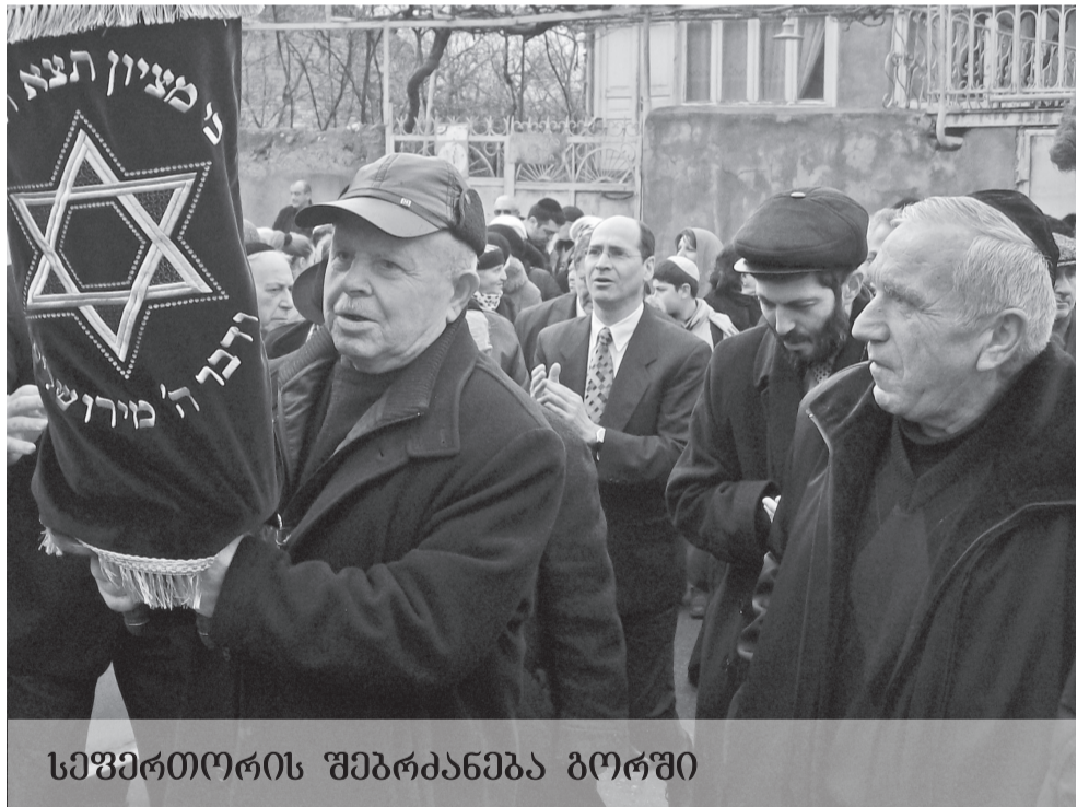
სეფერტორის უბრძანება ბორში

„მენორას“ მკითხველს ხანუქის დიდი დღესასწაულის დადგომას საქართველოს მთავარი რაბინი არიელ ლევის და საქართველოს მთავარი რაბინის მ.შ. ავიმელეხ