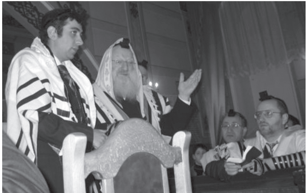
მოამზადა ლილია ზომენკო

— რაც შეეხება შეკითხვის პირველ ნაწილს, ალბათ უკეთესი იქნება ჯამაათს დაუსვათ ეს შეკითხვა, რადგან მე შეიძლება ჩამეთვალოს სუბიექტურობაში (იციინის). თუმცა, ამ მისიას, რომ ვერ ვასრულებდე,