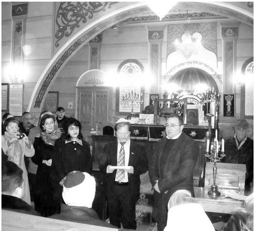
დასასრული მე-8 გვერდზე

აღნიშნა, რომ მნიშვნელოვანია გაეროს რეზოლუცია ჰოლოკოსტის მსხვერპლთა ხსოვნის ყოველწლიური დღის დანესების თაობაზე და მისი ერთობლივად აღნიშვნა, რათა საზოგადოებას შევახსენოთ მეორე მსოფლიო ომის დროს ნა-