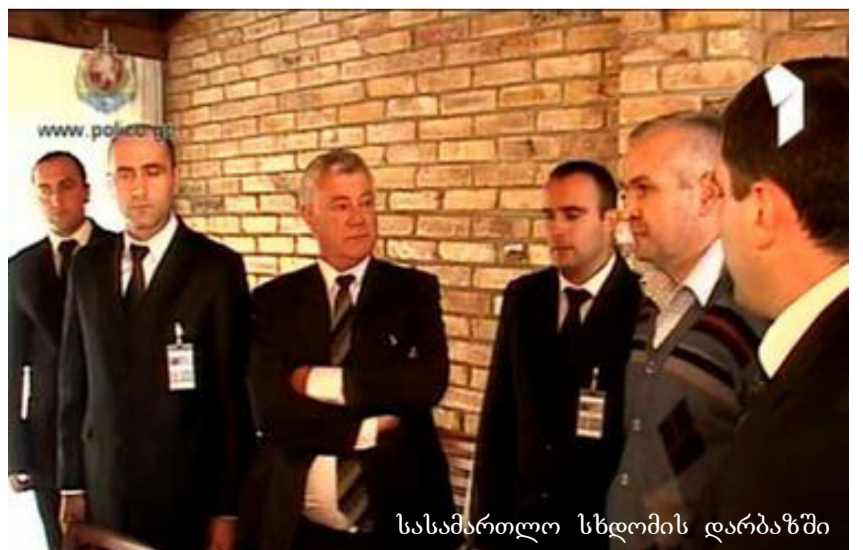
სასამართლო სხდომის დარბაზში

— აქვე ხაზგასმით მინდა აღვნიშნო, რომ საერთაშორისო საინვესტიციო ტრიბუნალის გადაწყვეტილება კონფიდენციალური იყო და რომ არა მისი გახმაურება საქართველოს