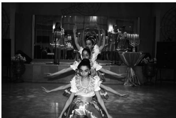
THE SYNAGOGUES IN GEORGIA