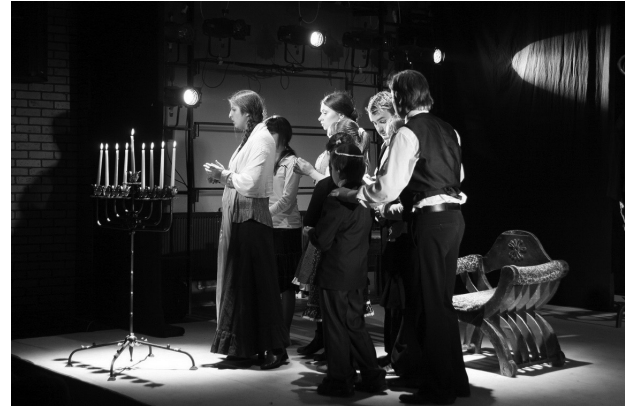
ნანერის — „დავითის გვირგვინის“ შესახებ. ივლისი