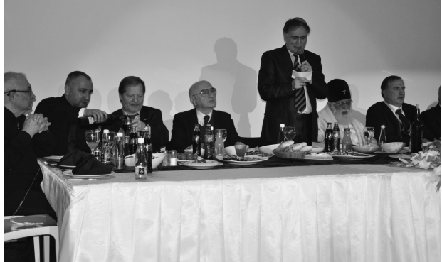
საქართველოს კათოლიკოს-პატრიარქის ილია II-ს შეხვედრა ისრაელის ქართველ ებრაელებთან

„მენორას“ 6 ნომერში საქართველოში ისრაელის სრულუფლებიანი და საგანგებო ელჩი იცხაკ