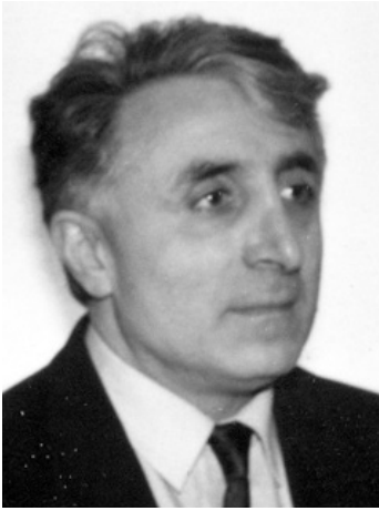
(ბაბრქელვა. ღასაწყისი 06 „მ“ №6, 7)