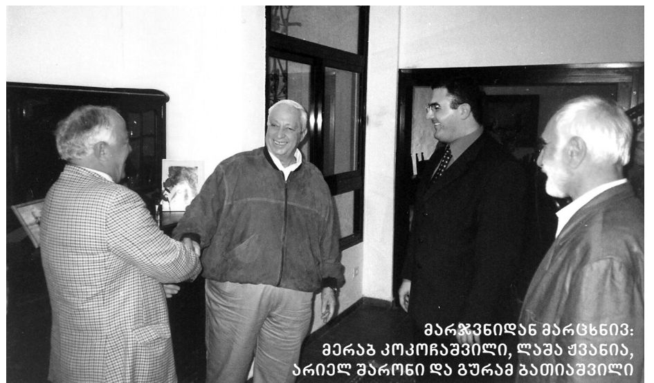
მარჯვნიდან მარცხნივ: მერაბ კოკოჩაშვილი, ლევა შვანია, არიელ შარონი და გურამ ბათიაშვილი

მოგვიანებით, ოჯახურ ყოფას რომ იგონებს, გვიამბობს: — კემ-დევიდის შეთანხმების წინ ქაიროსთან დიდი მოლაპარაკება გვქონდა.