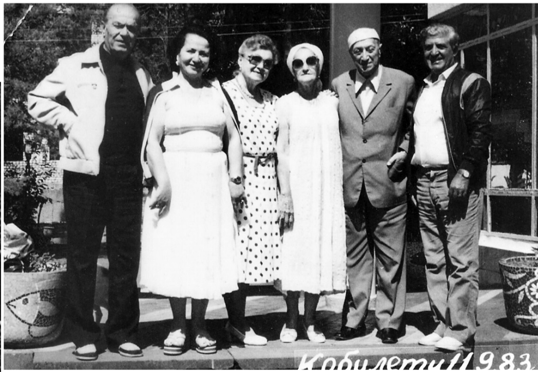
კინო დეილა 1983