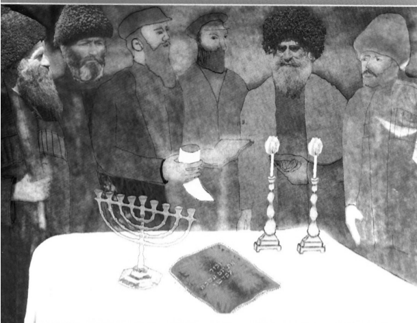
«Культурная революция», 2014