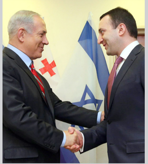
ზატვიცვით, ირაკლი დარბაზიელი თბილისი - 2015 წლის 19 მარტი

თქვენო აღმატებულებას, გულწრფელად გილოცავთ ზარტია „ლიკუდის“ გამარჯვებას ისრაელის საპარლამენტო არჩევნებში. დარწმუნებული ვარ, რომ თქვენი სანიშნო ლიდერობა და ქვეყნისადმი ერთგულება უსრუწველყოფს ისრაელის სახელმწიფოს წარმატებას, მშვიდობასა და კეთილდღეობას. ჩემთვის სასიხარულოა, რომ ისრაელსა და საქართველოს შორის ისტორიულ მეგობრობას ასაზრდოებს ჩვენი ნება და სწრაფვა, გავაძრმავოთ ჩვენი ზარტნიობა. ამის გათვალისწინებით, იმედის თვალთ შევუვრებ ჩვენს ურთიერთობებში შემდგომ წარმატებებს მომდევნო თვეებსა და წლებში. ნება მომეცით, კიდევ ერთხელ დაგიდასტუროთ ჩემი ზატვიცვითა და გისურვოთ თქვენ და ებრაელ ხალხს წარმატება და წინსვლა.