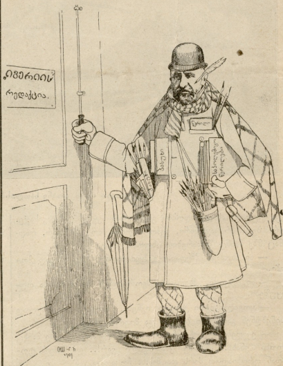
ანდუყადარ სანადიროთ საქართველო შეგყარაო, ჯიერანი ხომ ვერ მოკლა, ბეკამა სხვამაც დასყარაო; გაგვირისხდა ანდუყადარ, დაკრა ბუკი, ნაღარაო, აღიბურვა კურკ-ბურნუსით, (არ შემკიდეს, აღარაო), მხარზე გადავიდო აბავ, შოვ კაღლები ჩაყარაო, პასუხი ჯიბეშეში აქვს, უფერზო და ტალარაო...