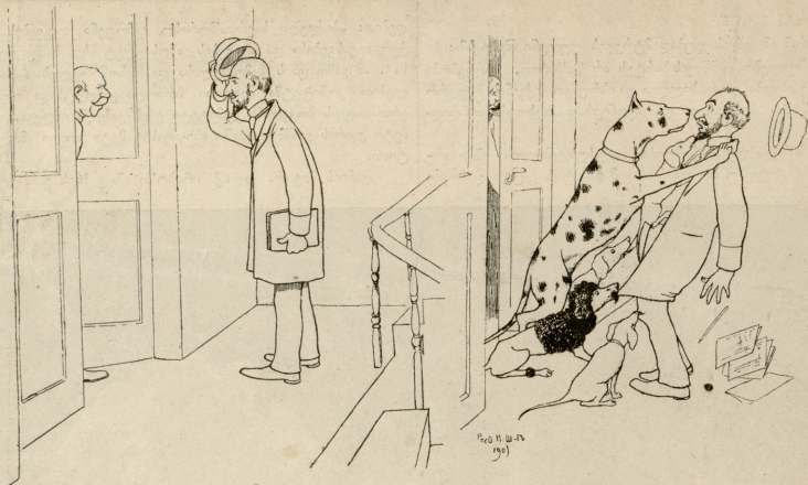
—უკაცრავად, მე ქალაქის აგენტი ვახლავართ, ძაღლები ხომ არა გყავთ, ზარკტი უნდა გამოგართვათ?