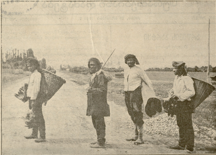
გამჭმადანებული აჭარელი ჭაროვლები

არწივმა ფრთები გაისწორა და სინათლის ეშით გატოცებულმა ისევ მალა-მალა გასწია! დალონდა ახალგაზრდა არწივი, მაგრამ მალე ამავე ფრთები გაშალა, თავ ნება შეგობარს თვლი მოაშორა, სხვა შეგო-