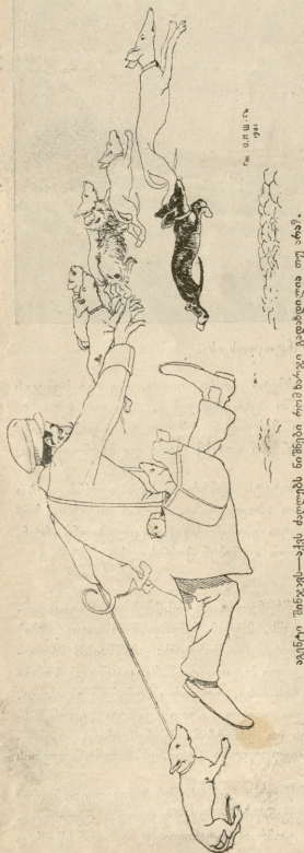
აგენტი შეჩვენებ—აქვს ძაღლებს ნიშნები რომ ზარკტი ვაძაბდილო თუ არა?