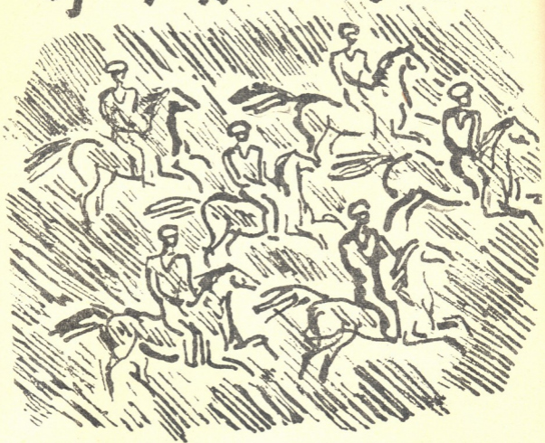
(ვიკლიდან „ჩემი მეზობელი ქისტავი“)

მთელი დღე მოღრუბლული იყო ცა. ნისლი ტყვიასავით მიძიმედ აწვა პანკისს. ჯანლი ებურა ხორეჯასა და ტბათანას, ჭორთაბუდისა და ჩხართანის ტყიან გორებს.