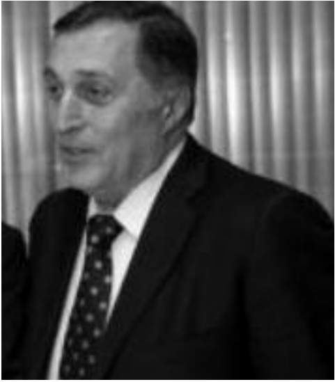
უკვე რამდენიმე თვეში ბაიროპევა როგორ იქნება მსოფლიო ბანის ახალი პარტია ქართულ პოლიტიკურ სივრცეში...

“თუ ვიგრძნობ, რომ სხვა ამკლუაში ვგვირდები ჩემს ქვეყანას, აუცილებლად გადავდგამ ამ ნაბიჯს!”