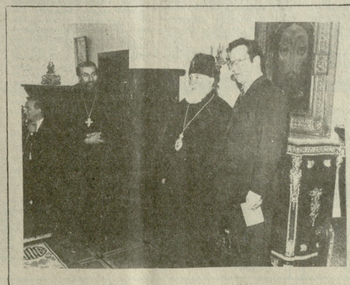
ბატონი შვარდნაძის, ბატონი კინკელის და ბატონი ლაიშვილის ფოტო (საქართველოს ფოტორეპორტაჟი).

სურათებზე, საბატონო კრავიშინების ელვარდ შვ- არდნაძისა და გერმანიის ფედერაციული რესპუბლიკის ვიცე-კანცლერის, სავარეო საქმეთა ფედერალური მინი- სტრის კლაუს კინკელის კრავიშინების, საბატონო სახელმწიფო მინისტრთან ნიკო ლაიშვილთან შე- ხვედრისას; სრულიად საბატონო კრავიშინების-კატ- რიკატთან, უფრედმეთან და უმხატარასთან ილია მთრე- სთან მიღებისას; შეხვედრა საბატონო კრავიშინების თამაშვლმარასთან ზურაბ შვანიასთან; საბატონო პარლამენტის ტრიბუნაზე ბატონი კლაუს კინკელი, სა- სტუმრო „მეტეში“ გამართული მიღება; ბატონი კლაუს კინკელი უფრე გერმანელი ტრეპვის სასაფლაოს.