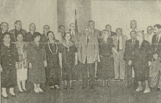
ჯილდოების გადაცემის შემდეგ. საქართველოს მკვლევარნი დაიწყეს საქართველოს ტრადიციული მემკვიდრეობის და ქართვის აღდგენა-განვითარების უზველად მოსაზრებების განხილვა.

შობა საგვამო ტაბარის მშენებლობის უწყისი. შობა საგვამო ტაბარის მშენებლობის უწყისი.