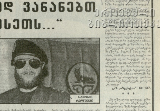
საქართველოს სახელმწიფო უწყებების განცხადებით