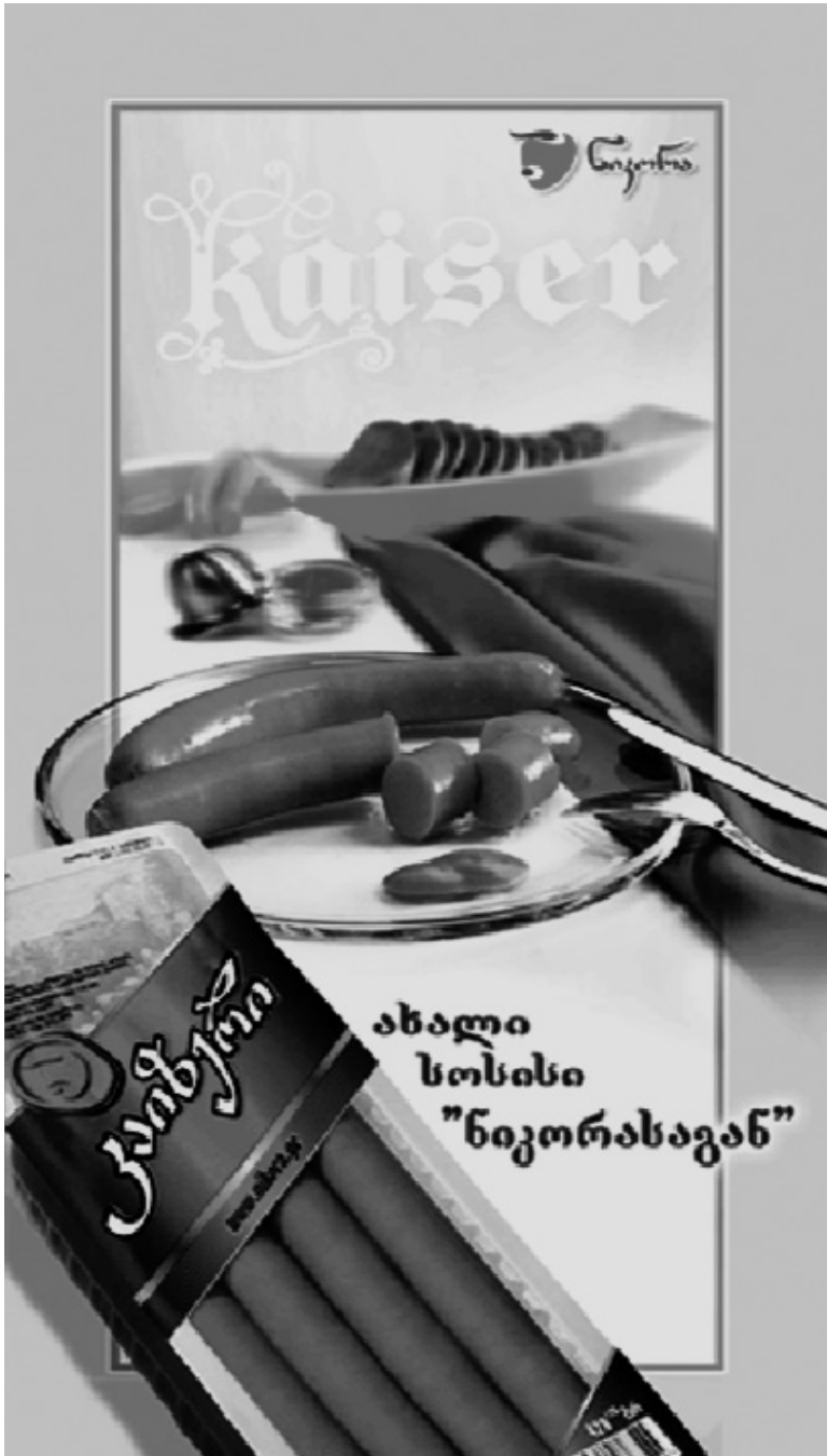
ახალი სოსისი "ნიკორასაგან"