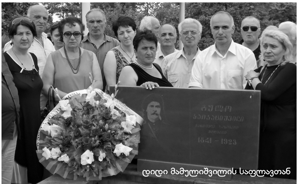
დიდი მამულიშვილის საფლავთან

1990 წელს ზვიად გამსახურდიასა და მერაბ კოსტავას მეთაურობით საქართველოში დიდი ეროვნული მოძრაობის აღმავლობამ განაპირობა ის სასიამოვნო ფაქტი, რომ აჭარაში ფართოდ აღინიშნა გულო კაიკაციშვილის დაბადებიდან 150 წლისთავი. ეს იყო ღვაწლმოსილი მამულიშვილის საყოველთაო აღიარება და დაფასება. სამწუხაროდ, დროთა განმავლობაში, მიზეზთა გამო, იგი როგორც ჩანს, დავიწყებას მიეცა, მსგავსი დამოკიდებულების გაგრძელება კი არ უნდა დავუშვათ. ამ საკითხებთან დაკავშირებით მამულიშვილთა საგვარეულო კავშირის გეგმებზე მოგვიანებით ვისაუბრობ.