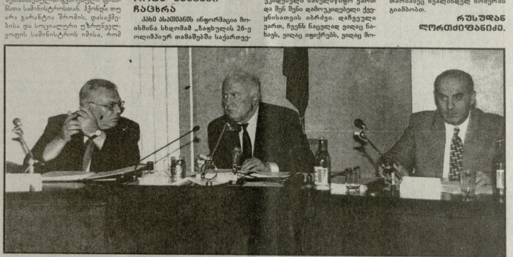
1990 წლის 11 დეკემბერს მიმდინარეობს პრეზიდენტის სხდომა.

დავით ბაგრატიონის ხელმძღვანელობით მუშაობს აღმასრულებელი ხელისუფლება. მისი უპირატესობა — სიზუსტე, სიჩქარე, სიხარული.