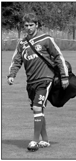
ქვემოთ შემოგთავაზებთ. — გასულ თვეში თქვენ ხანგრძლივი პაუზის შემდეგ „შაქსის“ ვარჯიშებზე დაბრუნება აღინიშნა. რამდენად სასიამოვნო გრძნობთ იყო, როდესაც პარტიზონობის მოედანზე შეურთიდათ? — შესანიშნავი გრძნობა იყო. როდესაც ფეხბურთელი იქ არ არის, სადაც მას გული მიუწევს, ყველაზე დიდი ტკივილია მის ცხოვრებაში.

დარჩენილ 8 გუნდში უკრაინისის გამართვა არ გაჭირვებულა. გუნდები მიმდინარე ჩემპიონატში დააკვეთული ადგილების მიხედვით განლაგდნენ და 4 მათგანი განთესილი იყო. თუმცა, 2 განთესილ გუნდს მანაც მოუწევს ერთად თამაში, რადგან 8 მონაწილე 2 ჯგუფად