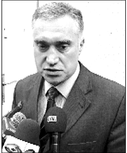
— რა პროცესებს უნდა ველოდო უახლოეს პერიოდში? თქვენ აცხადებთ, აქციებს და ვიწინებთ. როდის დაიწყებთ ამ აქციებს?

— აქციების ორგანიზებას დაიწყებთ აუცილებლად და ამ ტიპის ნაბიჯებს გადავდგამთ. მიმანია, რომ ეს უნდა იყოს ყველაზე მნიშვნელოვანი და სერიოზული. ხალხს თუ არ დავანახეთ, რომ ჩვენ შევცდილა მათი პრობლემების გამოტანა საჯაროდ, სახალხო და ამ პრობლემებზე გაიძლიერო ხელისუფლება, გარკვეული ტიპის გადაწყვეტილებები მიიღოს. ისე, ძალიან ინდივიდუალური საზოგადოება, რაღაც ერთგვარად სასწარმოველი მდგომარეობაშია და სასწარმოველი საზოგადოება შეუძლებელია იყოს ბუნებრივი.