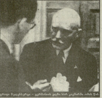
ერის მულერბერგი - გერმანიის გენის კანცლერი, რომელიც წინ