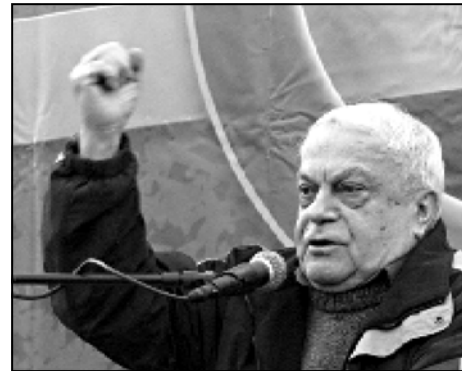
ნაციონალისტ 33 ირმაგარა უნდა ამოვიდეთ ერთ ადვალს და მერე ვნახავთ, როგორ დასტუდება მათი საერთო სჯერა

— რაკი თარგამაძე ვახსენეთ, საპარლამენტო ოპოზიციის გამოსვლაც შეეფასებო. მათ თითქოს მწვავე განცხადებები გააკეთეს. მათ ეს განცხადებები კარგა ხნით ადრე შეთანხმეს ნაციონალისტები. კითხვებიც და პასუხებიც წინასწარ იყო მოიჭერებული. ეს იყო სექტატული. რაც შეეხება ახალი მხარე და პატარაკაციანის ხსენებას, ესენი ჯანსაღი ფსიქიკის ადამიანები არ არიან. შესაბამისად მათ არ შეუძლიათ ვინმე ქვეყნის მტრად არ გამოაცხადონ. როგორც კი ვინმე გააქტიურდება, ეგრევე გამოვივლს და მტერს ეძახიან.