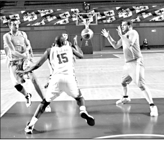
ანად თამაშს და ძირითადი დროს ფრედ — 70:70 დასრულდა.