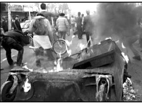
ბიდან ესროდნენ, ზოგიერთს ხელკეტებით სცემდნენ.

თეირანში ანტისამთავრობო დემონსტრაციის მონაწილეების და ძალადობრივ სტრუქტურების წარმომადგენლების მასობრივი შეტაკებები მოხდა.