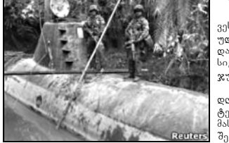
იყო დაჭურვილი, რაც ოთხი კაცისგან შემდგარ ეკიპაჟს შექსივად მისვლის შესაძლებლობას აძლევდა.

კოლუმბიო ნაპოვნი მოვაჭრის წყალქვეშა ნავი დააკავეს. კოლუმბიოდან მექსიკისაკენ კოკაინი გადაქონდა. მინასტატისკისგან დაზარალებული 31 მეტრი სიგრძის გემი ეკვეის სასაზღვო-დაცავლით, ტიპიურის სპეციალური იყო დაბალული.