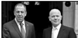
ლავროვის თქმით, არ არსებობს მიზეზები, რომლებიც რუსეთს და ბრიტანეთს დახლოების შეუძლებელი ხელს.

ლონდონის ეკონომიკურ სკოლაში გამოსული დროს რუსეთის საგარეო საქმეთა მინისტრმა სერგეი ლავროვმა განაცხადა, რომ რუსეთმა ზესახელწიფოს ამბიციებს თავი დააღწია.