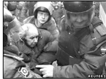
გაუსხილვი რჩება. რეზოლუციის ლაბარაკია აგრეთვე გასული წლის ბოლო დღის ბორის ნემცოვისა და ტრიუმფალური მოედანზე გამართული მიტინგის სხვა მონაწილეების დაჰატარების შესახებ.

ევროპარლამენტმა რუსეთის ხელისუფლებას კიდევ ერთხელ მოუწოდა, ბოლომდე გამოიძინოს ევროპარლამენტის და ადამიანის უფლებათა დამცველების რეზოლუციის მკვეთრობის და საქმით დადასტურონ რუსეთის პრეზიდენტის განცხადებები კანონის უზენაესობის შესახებ. გარდა ამისა, ევროპარლამენტის დეპუტატებმა აღნიშნეს, რომ უკრაინისა და კორუფციის პირობებში მოდერნიზაცია მისაღწევად დასრულდა.