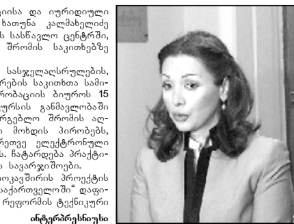
ინტერბრესის რეჟისორი ნათუნა კალაშნიკა

სასჯელალსრულებლის პრობაცია და იურიდიული დახმარების საკითხი მინისტრი ნათუნა კალაშნიკა სასჯელალსრულებლისა და პრობაციის სასწავლო ცენტრში, საზოგადოებისათვის სასარგებლო შრომის საკითხებზე მიმდინარე ტრენინგს დაესწრება.