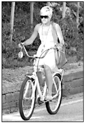
პინკი გავსს ელოდა

როკ-ჯარსკვლავ პინკ პარკი რაში შესვენება აქვს აღუდგა. ამის მიზეზი კი მისი ფეხმძიმობა გახლავთ. ამ ინფორმაციამ ყველაზე მეტად, ცხადია, პინკის მეუღლე გაეახარა. მოტომობილში კარი პარკშია და მომღერალმა 2006 წელს იქონიწნეს. მიუხედავად იმისა, რომ ორვიეს სურდა შეიღებინა ყოლა, პინკის გადატირებული გრაფიკი ამ ფუფუნების საშუალებას არ იძლეოდა.