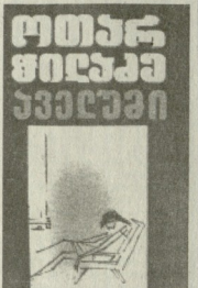
სასკოლო პრობლემები მისი მხარეზე...