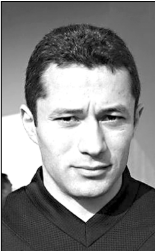
ლეხელი არის საქართველოს ჩემპიონატში მთამაშე ფეხბურთელებისთვის, რადგან ცელინებათ, რომ ვინც დაიხასხურებს, ნაკრების კარი ვცვლასთვის ილია.

— ისევ საბერძნეთში აბირებთ დარწმუნებას? — სხვა ქვეყნებიდან მათს ნინადღებენ, მაგრამ გერ დაკონკრეტება არ მინდა.