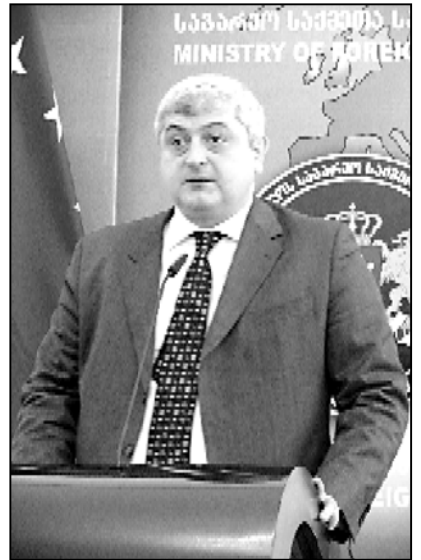
ქვემოთაა ვაშაძე არ არის დასრულებული და შესაბამისად განაგრძობს ცნობილი არ არის.

— მალბაშიაში სასამართლო პროცესი იურიდიული თანმიმდევრით მიმდინარეობს. რამდენადაც ჩვენივე ცნობილია, ქალბატონი გორდონის საქმეზე მოსმენა დანიშნულია. სასამართლო ქიშორი ექსპერტის პასუხს ელოდება. ამის შემდეგ წინამართბა შესაბამისი სასამართლო სტადია, — განაცხადა საგარეო საქმეთა მინისტრის მოადგილემ.