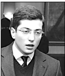
ანთროპოგენული და ბიოკოზმული დაბინძურება