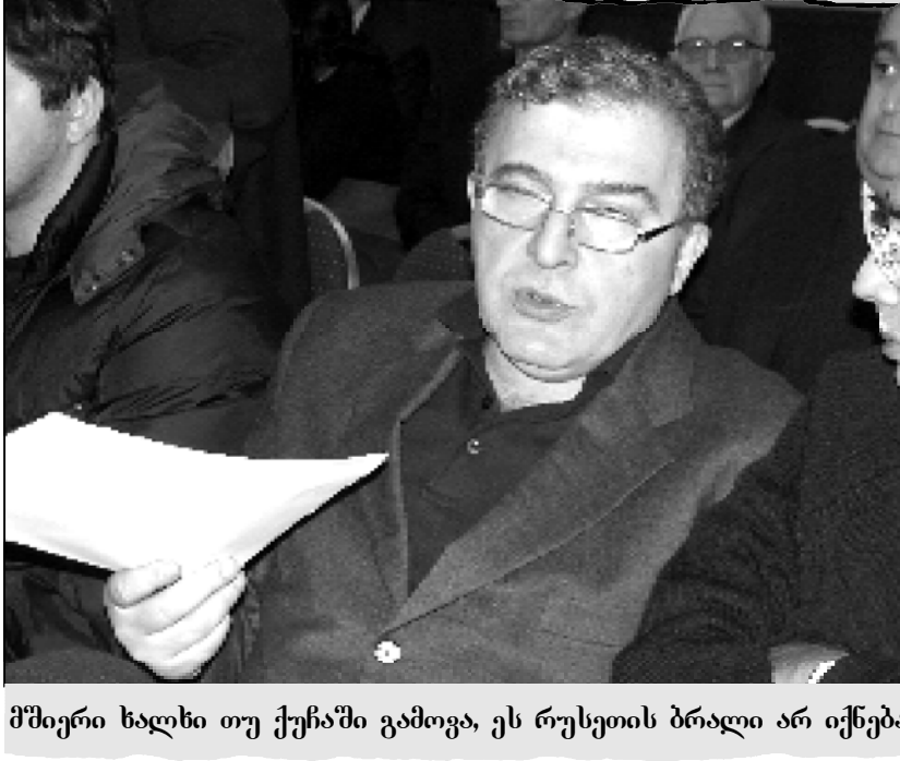
მშვიერი ხალხი თუ ქუჩაში გამოვს, ეს რუსეთის ბრალი არ იქნება

— ასე მარტივად არ არის საქმე, რომ ერთი ანონსები და მეორე ანონსები, რომ ეს ხელისუფლების ნიშნები წყალს ასხამს. ჩვენ მიხვედით ვართ იმას, რომ ჩვენი პატარა ქვეყნის ჩარჩოში ვართ ჩაკეტილი და ამ გადასახედებიდან ვუყურებთ მოვლენებს, კედლებს განცხადებები რომ ეს ყველაფერი სააკაშვილის ნიშნულზე დაასხამს წყალს. თქვენ, როგორც ექსპერტი, როგორ შეაფასებდით ამ ყველაფერს?