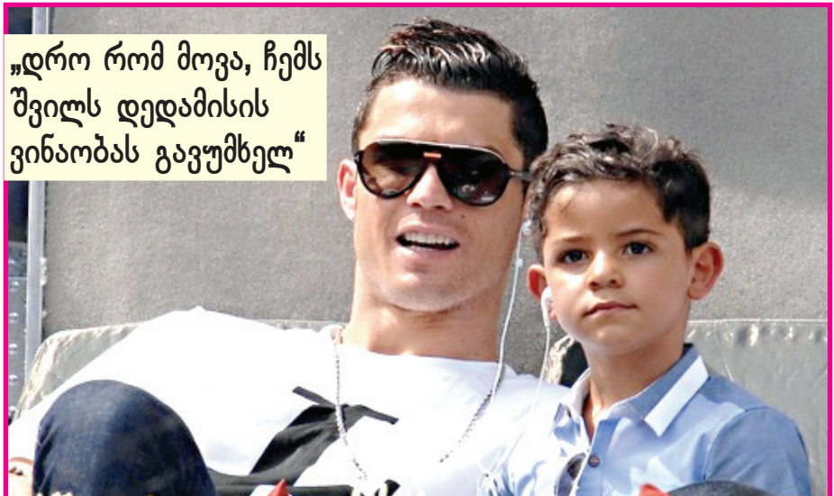
„დრო რომ მოვა, ჩემს შვილს დედამისის ვინაობას გავეუმხელ“

პორტუგალიელი ფეხბურთელი კრიშტიანო რონალდო ერთ-ერთი იმთავანია, რომელსაც მთელი საფეხბურთო სამყარო დიდ პატივს სცემს, საკლუბო დონეზეც წარმატებებს აღწევს, მაგრამ ამ სანაკრებო დონეზე ჯერ ვერაფერი მოიგო.