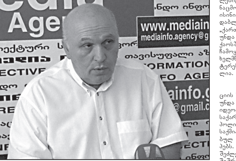
„ქართული ოცნება“ ჩამოყვალის მხარეა

– პარტიში განხორციელებული ტერორისტული თავდასხმების შემდეგ საქართველოში მთავარი განსახილველი თემა გახდა ის, თუ ვინ მოიწვევს სხდომას უსაფრთხოების საკითხებზე – მარგველაშვილი თუ