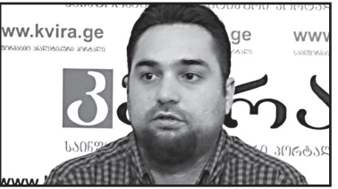
ახლახან თურქეთთან ვითარების დაძაბვას ემბარგოები მოჰყვა. ჩვენს ოკუპირებულ ტერიტორიებზე განსაკუთრებული არაფერი ხდება. ადამიანთა გატაცებები ადრეც ხდებოდა.

– მთელი უცნაურობა ის არის, რომ რუსეთის სახელმწიფოს წარმომადგენლები არ ახორციელებენ იმას, რაც სჭირდება მათ ქვეყანას. ამ წუთისთვის რუსეთს ანაყობს, ყველა მხარესთან ნაკლები დაძაბულობა ჰქონდეს. ის კი, პირიქით, ყველა მხარესთან ამწვავებს ურთიერთობას. ახლახან უკრაინასთან კვლავ დაძაბა ურთიერთობა, გაზი შეუწყვიტა.