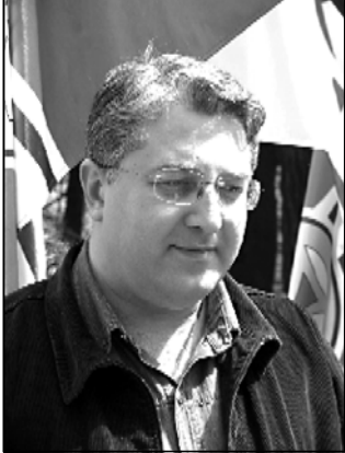
ტატებმა საკუთარი მოსაზრებები გამოთქვეს და მთავრობის მისამართით კრიტიკაც არ დაიწყეს.

ქვეყანაში ნაადრევო სიკვდილიანობის რიცხვის შემცირებაზე პარლამენტში მჯავლობდნენ. ჯანდაცვის ექსპერტების აზრით, ქვეყანაში, მათ შორის დედათა სიკვდილიანობის მიზეზებში მნიშვნელოვანი წილი აქვს პაპერტონის – მაღალ არტერიული წნევის.