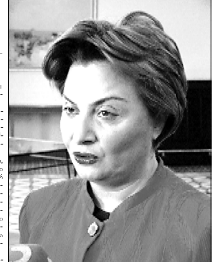
ვოქვათ, სანამ საქარტელოში არ მოხდება დიდი ქლაქების მერების პირდაპირი წესით არჩევა და ამის ნდობის საფუძველი არ განწდება კონსტიტუციის დონეზე, უნდა დავიგინოთ და გაავაქშიოთ მათორტირების კორპუსი, როგორც პოლიტიკური სისტემის ნაწილი. როგორ წარმოგადგინოთ ალასანია, თარგამამეს და სხვებს, სანამ ცესკო არ შედგება პარტიების საფუძველზე, რომელიც შიდა კონკრეტული დონეზე იქნება პასუხისმგებელი თავისუფალი არჩევნების შედეგებზე. მანამდე რეჯოლეჯიურ არჩევნებზე ლაბარაჯი უდემდეგი. თუ კანონის დონეზე არ ჩანინარ ხმების ხელახალი გადათვლა საქარტელოს შემთხვევაში, რომელმაც შეიძლება არჩევნების შედეგც შეცვლის, რეჯოლეჯიურ და მით უმეტეს, თავისუფალ არჩევნებზე ლაბარაჯი უდემდება. თუ კანონის დონეზე არ განისაზღვრა, რომ არჩევნები გახდეს საავადგულო საქარტელოს ყველა მოქვალისთვის, რაც იმას ნიშნავს, რომ ხალხი ქვეყნის შიგნით და გარეთ უნდა იყოს მიბილიზებული, რადგან ისინი ირჩევენ ქვეყნის მომავალს, მანამდე თავისუფალი არჩევნებზე ლაბარაჯი არ იქნება. საჯალდებულ არჩევნებში უნდა ვაერთათი ამ ხელისუფლებას მიტყვებილი ხელისუფლება და ხალხმა უნდა დაიბრუნოს თავისი ძალაუფლება.

— რაზე ვიქვითებ, ამ ეტაბისთვის ოპოზიციის ორივე ფონი უკვე ნაკვეთი მდგომარეობა არჩევნებზე წამსვლელიც და ე.წ. რეჯოლეჯიური არჩევნებ? — ნაკვეთი საქარტელო. ჩვენი მზანის ის კი არ არის, რომელი ლიდერი ნაკვეთი თუ მოიქვებს, მიზანია — ქვეყანაში მოიგოს. არც ერთი მიმართულებით, არც მეორე მიმართულებით, საქარტელო არ მოიქვებს. მოიქვებს შროლოდ მაშინ, როცა ხალხს დაუგერუხები ერთობრივი რეგიონისგან მიტყვებული ძალაუფლება. — ნინოსარ ნაკვეთი ბროლოში შედიან ბურჯანაძე და მისი თანამორიხები? — ქვეყნისთვის ასეა. მაგრამ ლიდერებისთვის ეს შეიძლება მტრეკლები წარმატების მიმდინი იყოს. მაგრამ შევეცდებით ის პოლიტიკური რეალობაში? — მეტ-ნაკვეთ წარმატებაში ფინანსურ საბეჭდოსაც გულისხმობთ თუ შროლო დროებითი პოლიტიკურ დივიდენდებს? — ორივე. იმიტომ, რომ უკვე იყო აქტიური პოლიტიკაში ნიშნავს იმას, რომ ქვინდება შენი იმენტიტი, პრივილეგია, სარგებელი ფინანსური, პოლიტიკური, იდეოლოგიურიც და ა.შ.