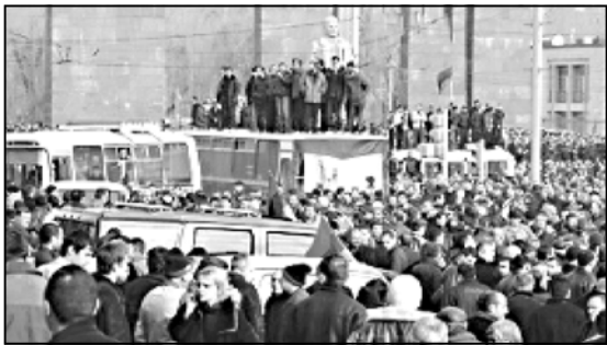
„მეტენადერანას“ შენობასთან გააქტიურდა ოპოზიციის აქცია

აქციისთვის საგანგებოდ მოემზადეს ხელისუფლებამ, როგორც ადგილობრივი მედია იუნკება, სამართალდამცავები ქალაქის ცენტრში იყვნენ მომიწოდებული. ოპოზიციამ აქ-