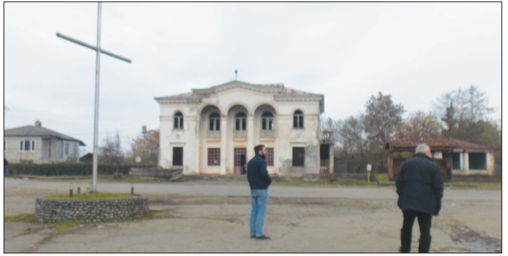
ურად შეკეთდა საბავშვო ბაღი, ნასათბარის უბანში გაკეთდა სტადიონი და ჭალაში მოეწყო ქუჩის განათება. გაზიფიცირებულია მთელი სოფელი ახლა, პირველ რიგში, უნდა მოწესრიგდეს გზა და მოსახლეობა უზრუნველყოფილი იქნეს სასმელი წყლით.