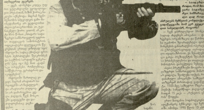
რადიო მთავარი სამმართველო...