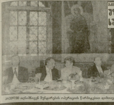
კრძავი და მწიფე მურგობის ოპერაციის წარმატებით დამთავრება.