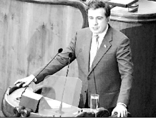
ებრაელი ბიზნესმენების ბრალად საქართველოს ხელისუფლების მალაქა ჩინოსნისთვის ქრამის მიცემა უდგება. ებრაელი ბიზნესმენების საქმით არაერთი საერთაშორისო დონის მაღალჩინოსანი არის დაინტერესებული. გაავრცელებული ინფორმაციით, მიხედვით სააკაპილმა ამერიკელმა მაღალჩინოსანებმა არაერთხელ სთხოვეს აღნიშნული საქმით დაინტერესება და მათი განთავისუფლება.

მართალია ებრაელი ბიზნესმენების შეწყვეტა მიხედვით სააკაპილმა დედასწავლისთვის ვერ იმ-სანსო, მაგრამ თუ კულტურული ინფორმაციით სააკაპილმა მართლაც შეწყვეტა ებრაელი ბიზნესმენები, მაშინ ეს საშუალო იქნება მათთვის. ებრაელი ბიზნესმენების სასამართლო პროცესი უკვე გაიმართა და მათ ქართულმა მართლმსაჯულებამ სისხლის სამართლის კოდექსით ერთს 6 წლიანი პატიმრობა და მეორეს 8 წლით თავისუფლების აღკვეთა მიუ-საჯა.