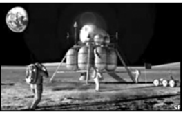
სვადასხე სამკურნალო საშუალების შემცველი ოთხი კოლონი უკანაშია. ზუსტად ისეთივე ოთხი კოლონი დედამიწაზე, ჯონსონის კოსოსური კვლევების ცენტრში დარჩა.

აშშ-ის ლიდერ ჯონ-სონის სახელობის კოსოსური ცენტრის მკვლევრებმა დაადგინეს, რომ დედამიწისათვის ჩვეული მცდელობების მიუხედავად კოსოსში მკვეთრად მცირდება ანტიბიოტიკების ინფექციის მოკვლის ვერ ახერხებენ. ამერიკელი დარბაზების საინჟინერო ასოციაციის ჟურნალში გამოქვეყნებულ სტატიაში ავტორები ვრცელდებიან, რომ სამკურნალო ეფექტის დაკარგვა კოსოსური რაიონის ფონთან არის დაკავშირებული. ავტორები ასევე მიაჩნიათ, რომ კოსოსისთვის მისი განაგრძობა მათთან ერთად კოსოსურ სადგურზე მდიდარად მოხიზვნილია მკვლევრები.