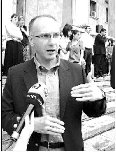
აქსიების ჩატარება შესაძლებელია 20 მეტრის რადიუსში

შეხებისა და მანიფესტაციის ჩატარება სახელმწიფო დანახვიდან 20 მეტრის რადიუსში შესაძლებელი ხდება. აქამდე ეს ახადელი იყო. 2009 წელს, ხოდაც პარლამენტმა აწინააღმდეგა 20 მეტრის რადიუსში ახადების და მანიფესტაციის ჩატარებას, ამას ოპოზიცია ეწინააღმდეგებოდა. საპარლამენტო თუ საპარლამენტო ოპოზიცია მმართველ პარტიას იმის გამო ახიტიებდა, რომ მთელ ხოდა სახელმწიფო დანახვიდან ახადების ჩატარება 20 მეტრის რადიუსში იხადებოდა.