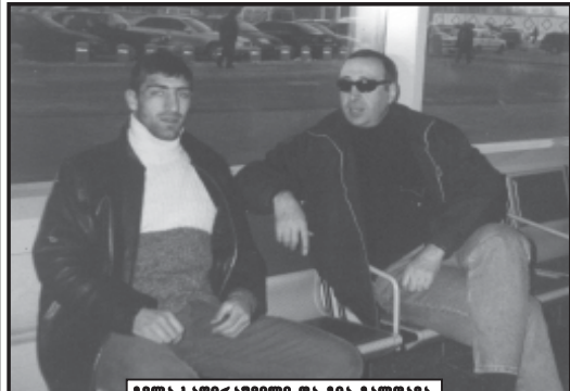
გელა სპორტიზტი და მათა გალდავა.

— ამავე დროს კი, გარკვეული გაციების მაშინაი კი იგრანბობა, როცა ახალი სტადიონები ხისნება. — საკუთარ მინდორზე თამაშში თქვენს ძლიერ ფოტოერ იმპულსს მოტივაციუ დატვირთვით მარს. მეორე მხრე, დიდი პასუხისმგებლობა იტვირთეთ, თქვენს სიმტკიცეში დიდი ნდობა უნდა გაამართლოთ.