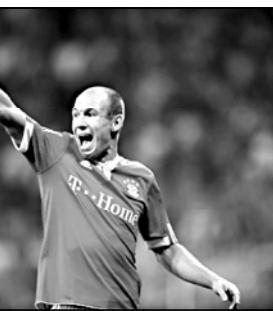
სადაც არ უნდა გადაესვლიყავი, ყველაზე მეტად უნდა კარი და ცუდი პერიოდები.