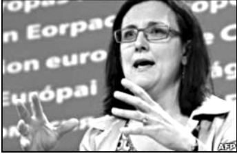
ევროკომისიის წევრი, შენგენის შეთანხმების წესების შედგენის ინიციატივა იტალიაში და საფრანგეთში წამოაყენეს, რომლებიც აფრიკის ქვეყნებიდან იმიგრანტების მოძალდების ფაქტის წინაშე აღმოჩნდნენ.

ევროკომისია გაერთიანებული ევროპის საბინაო საზღვრებზე დროებითი სასაზღვრო საკურო კონტროლის გამართვის წინადადება წამოაყენა.