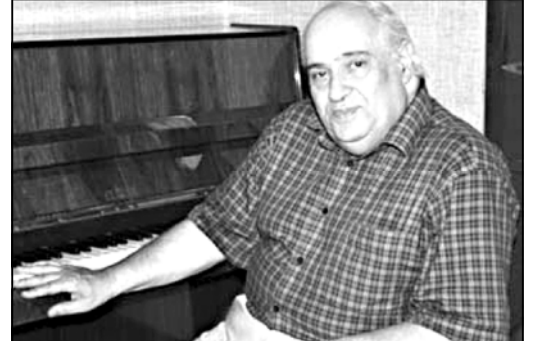
შემა ოფიციალურად, რომ ის არავის გადაუყენებია და თავად დატოვა თანამდებობა.

— შეიძლება კარგია, რომ შავათავა გადააყენეს, ბევრი კაცოფილი დარჩენილია ამ ნაპიჯით, მაგრამ გადაყენებაც უნდა იქნებოდეს.