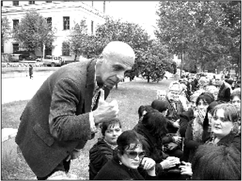
შეილება სააკაშვილის დასაცინი გავხდეთ

უნდა გავაგებინოთ, რომ ჩვენი ბრძოლა მხოლოდ საარჩევნო გარემოს გაუმჯობესებისკენ არ არის მიმართული.