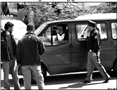
თუ მარხვია ე

9 მაისს კახეთს ქართული პარტია სტრატეგიაში. მათი აქცია საკმაოდ ხმაურიანი გამოდგა. აქციის ჩასატარებლად თბილისიდან რამდენიმე ასული ადამიანი წავიდა. ადამიანების გადაყვანისთვის ბუნებრივია საჭირო იყო ტრანსპორტი. ქართულმა პარტიამ თანამართლების გადასაყვანად რამდენიმე ათასი „პარპრუტკა“ იყირავა. ნამდვილად ვერ გეტყვით, რაც თანხა გადაუხადა ქართულმა პარტიამ ამ მძლავრებს. გუშინ განვითარებული მოვლენებით თუ ვიმჯობნებით, მათ ამ თანხის აღება საკმაოდ ძვირი დაუჯდებათ.