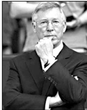
ვითამაშებთ. ისე კი, მომდევნო მატჩში ჩემპიონობის განმარჯვებელი ქულაც რომ ავიღოთ, ამითაც კმაყოფილი დავრჩებით.

რასაკვირველია, ჩვენი უმ-ბიარესი საზრუნავი ლონდონის „უე-მბლზე“ გასამართი მატჩია. მიმდევ-რი დღეების განმავლობაში, პეკ გერ-დიოლას გუნდის წინააღმდეგ საზარე-ულობა უკეთესი კონკურენტორულ-ობა, მაგრამ ეს სრულდება არ ნიშ-ნავს იმას, რომ პრემიერლიგის მომ-დევნო შეხვედრას „ბლუზმენ როვერ-სთან“ ოდნავ მოდუნებულები ჩავატა-რებთ. პრემიერლიგის 1995 წლის ჩემპიონობის სადღისოდ გასაგარდის ზონისთან ახლოს იმყოფებთან, ამიტო-მაც იოლად არავფრეს დაგვიმობინ-სეთიარულად მოვეციდებით მატჩს კიდეც ერთ აუტსაიდზე „ბლუკეტ-თან“. ორივე გუნდი ჩვენი მუშეობი-ქალებების წარმომადგენელია და მან-ჩესტერული გულშემატკივრების გასა-ხარად, მათთან მხოლოდ მოგებაზე