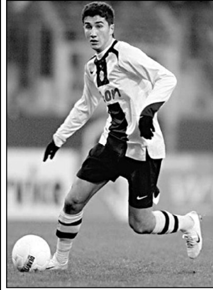
— მადრიდის „რეალში“ გადასვლა თქვენთვის რას ნიშნავს?

მიმდინარე სეზონი დორტმუნდის „ბორუსიას“ კაპიტანი ნური შაპინისთვის კარიერაში საკუთესოდ აღმოჩნდა — თურქმა ფეხბურთელმა ჯერ ბუნდესლიგა მოიგო, ხოლო გასულ კვირამ მადრიდის „რეალთან“ 6-ლიანი კონტრაქტი გააფორმა. შაპინი გერმანიაშია დაბადებული და დორტმუნდელთა საფეხბურთო სკოლის აღზრდილია. მან 2005-11 წლებში, „ბორუსიას“ შემადგენლობაში ჩატარებული 152 მატჩში 17 გოლი გაიტანა. „რეალის“ მიერ 10 მილიონ ევროდ შექმნილი 22 წლის შაპინის ინტერვიუ, ინტერნეტ-გამოცემა „ლოკომოტივ“ გამოქვეყნდა.