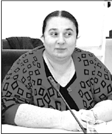
ნინო ცაბა ე

— ქალბატონო ნანა, რას უნდა ველოდით 26 მაისისთვის? სულ სხვადასხვა ვერსიებზე საუბრობენ. ცნობილია, რომ სახალხო კრება აქედან 21 მაისს იწყება და ამ დროისთვის რუსთაველზე იქნება, ჩაატარებს ალღუმ სააკაშვილი? — ამ დროისათვის რომელი