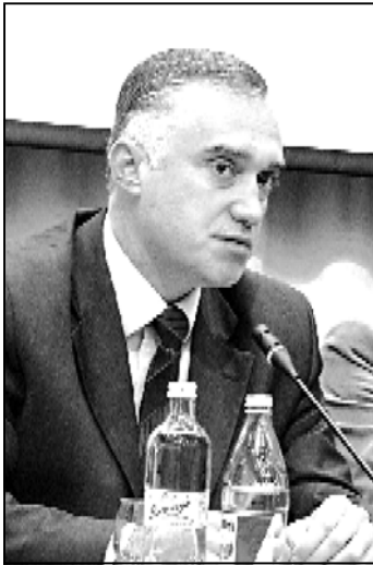
რევოლუციური პროცესების მომხრეებს.

„რეიანის“ წევრები აცხადებენ, რომ ხელისუფლება ხელს უწყობს პროცესების ქუჩაში გადატანას და