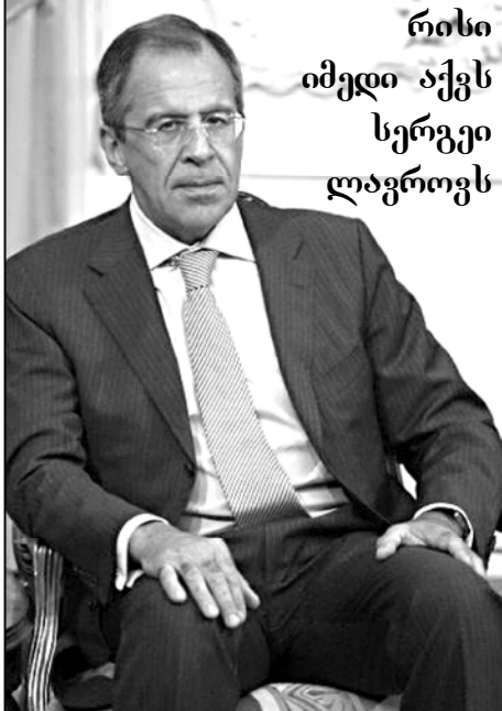
რისი იმედი აქვს სერგეი ლავროვს

გენერალურმა მდივანმა აშშ-ში ტურნე 7 მაისს დაიწყო. 13 მაისისთვის დაგეგმილია რასმუსენისა და აშშ-ს პრეზიდენტის ბარაკ ობამას შეხვედრა.