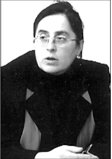
მიუთქმუნა 21 მაისის დაგეგმილი ელექციები.

მიუთქმუნა 21 მაისის დაგეგმილი ელექციები. ამ დღიდან სახალხო ხელისუფლების გასაშვებად უნდა დაიწყოთ მომხილები ამჟამინდელი ხელისუფლების წინააღმდეგ და აუცილებლად უნდა შეიცვლებოდეს ხელისუფლება.