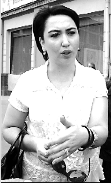
ოპოზიციის შიგნით საზოგადოებას ძალიან აბნევს.

არ უჭერს. ეს ფოქებადსაშიში სიტუაცია მას შიშის ქვეშ აყენებს. მაგრამ, მიიღო, შევხედოთ იმას, რაც ხდება ოპოზიციის შიგნით: შეგნებულად ვიკავებთ იმ ბოლო პერიოდში, რომ არ ყოფილიყო დასავლეთის ხელის ბიჭი. ამ ორი ბატონის მსახურებამ განაპირობა ის, რომ ქვეყანა დიდი რეკვიზისა და დარტყმის ქვეშ აღმოჩინდა. დღეს ძალიან შეცვლილია სააკაშვილის მიმართ დასავლეთის დამოკიდებულება. ყველაზე დიდი დარტყმა სააკაშვილის იმიჯს აგვისტოს ომმა მიყენა. მან ანეროპორის საზოგადოება ვერ გააცურა, ტალი-აბრისი დასკვნამ კარდინალურად მოაჯირბინა სააკაშვილის სანადალდეგოდ საერთაშორისო საზოგადოებას.