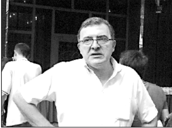
ნინ, რომელიც საქართველოში ნახევარ მილიონზე მეტნი არიან და მათი აზრი მართალია. თავის მხრივ ყველა აზურბაიჯანელი საქართველოში მხარს უჭერს ქვეყნის მუსლიმთა სამმართველოს შექმნას, რომელსაც პატრიარქი შეიხ ალბანშუევი ფაშაზადე ხელმძღვანელობს. — განაცხადა ალიევი.

ქართველ მუსლიმანთა სამმართველოს შექმნას გამოსმაურება მოჰყვა. ბაქოში ამ ნაბიჯის უკან „სომხური იდეა“ დაინახეს და შეუერთება გამოსატეს. თბილისში ამ ვერსიას კატეგორიულად უარყოფენ და აცხადებენ, რომ საქართველოში მრავალი მუსლიმანური თემი არსებობს და აუცილებელია, მათ საკუთარი ორგანიზაციონი შექმნიან.